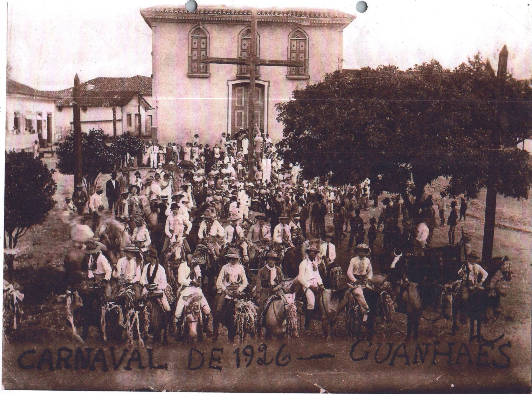
CARNAVAL DE 1926 — GUANHAES